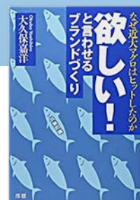
滞標社 欲しい!と言わせる ブランドづくり