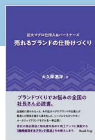
ブックトリップ 売れるブランドの 仕掛けづくり