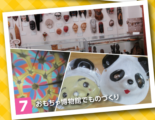
7 おもちゃ博物館でものづくり