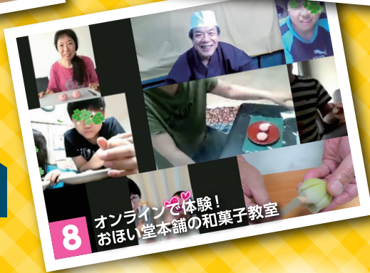
8 オンラインで体験!おほい堂本舗の和菓子教室