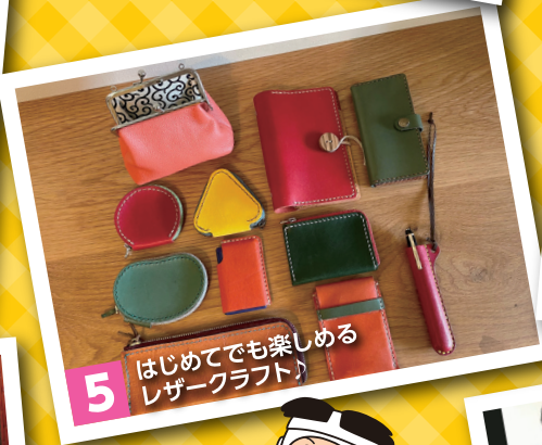
5 はじめてでも楽しめるレーザークラフト