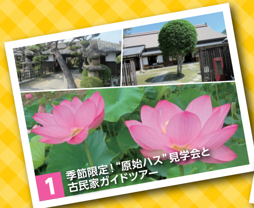
1 季節限定!“原始ハス”見学会と古民家ガイドツアー