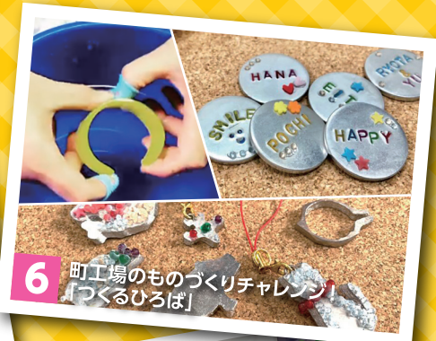
6 田工場のものづくりチャレンジ「つくるひろば」