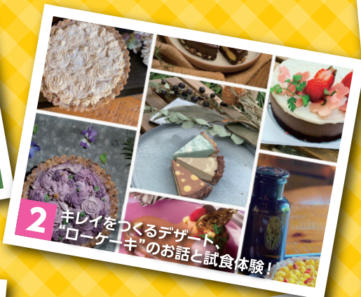
2 キレイをつくるデザート“ローケーキ”のお話と試食体験!