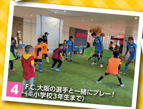
4 F.C.大阪の選手と一緒にプレー! (※小学校3年生まで)