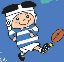
東大阪市 マスコット キャラクター トライくん