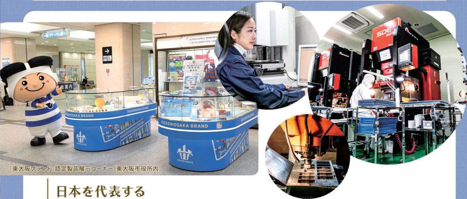
『東大阪ブランド』認定製品展示コーナー[東大阪市内]