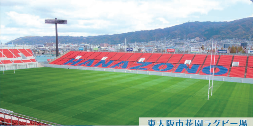
東大阪市花園ラグビー場