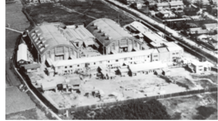
② 帝キネ長瀬撮影所跡 ⑧ 現在樟徳館

⑭喫茶美術館 司馬遼太郎さんの街道をゆくの挿絵を描かれていた洋画家・須田剋太さんと人間国宝であった民芸陶芸家・島岡達三さんの美術館を兼ねた喫茶店です。 平日/14:00~18:00 土日祝/12:00~18:00 TEL/06-6725-0430 定休日/水曜日(ただし、祝祭日は営業)