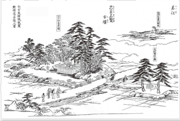
河内名所図会1801年(享和元年)