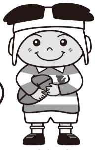
東大阪市 マスコットキャラクター トライくん