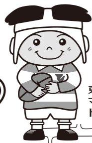
東大阪市 マスコットキャラクター トライくん