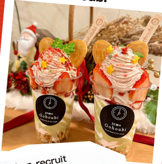
八戸ノ里駅/文化創造館近く 19時のGohoubi

urban_recruit 仕事終わりに後輩と...🍓🍓🍓 クリスマス限定メニューで可愛い...!🥰 近畿大学や大阪商業大学が近いので、 駅周辺はおしゃれなお店が沢山あります🌟