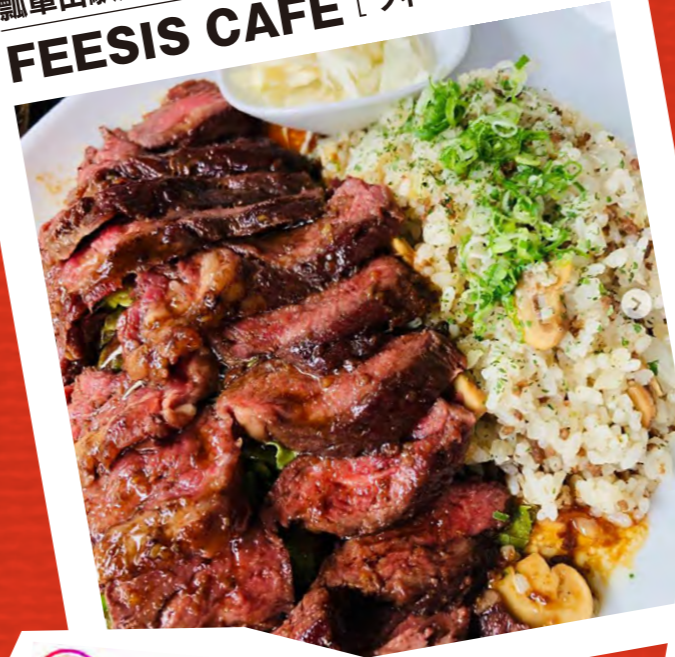
瓢箪山駅/花園中央公園近く FEESIS CAFE [フィースカフェ]

karaage.photo お肉とガーリックライスが最強。 マッシュルームが可愛くて好き🥰 みんなに食べてもらいたい!! ほぼ100パーセント毎回これ食べてるwww